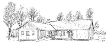
Bolmsö Bygdegård Sjövikén